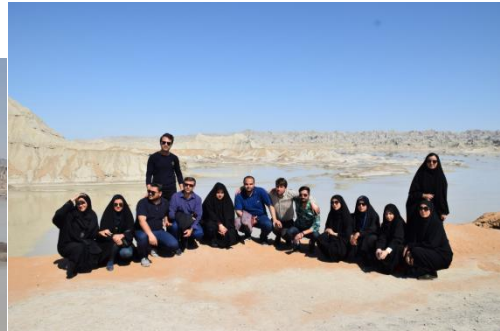
کوه های مریخی چابهار